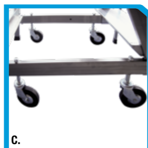
A. Versione CCBR/A B. Versione CCBR/MA C. Versione CCBR/AA